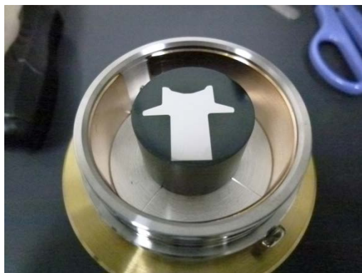
図1 樹脂埋め込みされたボルト断面

異種金属の層状構造を確認し、異種金属層状構造が水、酸素の侵入を防止して、防錆処理の高い性能を実現できることを明らかにした。奈良先端科学技術大学院大学ナノテクノロジープラットフォームを利用することにより、ノーハウを科学的に解明することができた。今後の研究開発においてもさらなる活用を図り、製品化に役立ててゆきたい。