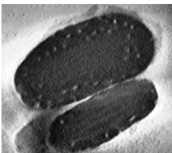
図1 ヒト毛髪メラニン顆粒の超高压電顕像

2. マウスのメラノーマ（黒色腫）から単離したメラニン顆粒についても同様に三次元構造の観察を行った（図3は断層図）。この構造解析の結果、顆粒内部の球状構造の存在及びその立体的分布が判明し、「単離メラノソームの微細立体構造に関する研究」として第24回色素細胞学会学術大会（於：長浜バイオ大）で発表した。