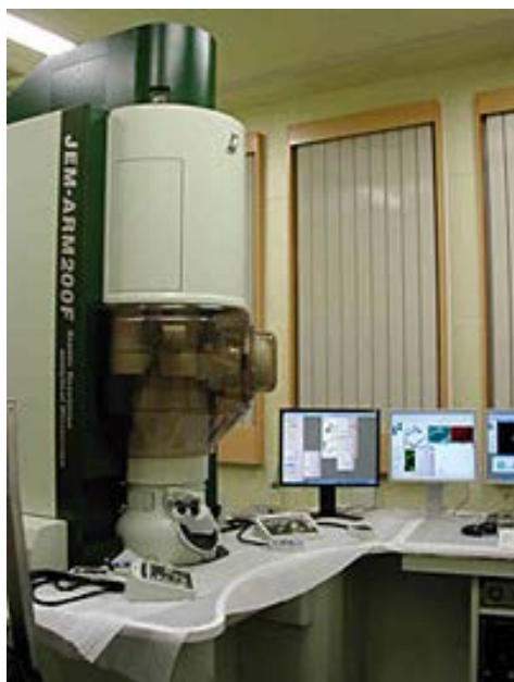
図1 球面収差補正付STEM

その結果、NiPtPdナノ粒子は多面体形状で、稜線や頂点にPtが偏析しており、中心がPdリッチ、周辺がNiリッチであるような構造を有していることが明らかとなった (図2)。この構造情報は、NiPtPdナノ粒子の生成機構を理解する上で重要なだけでなく、NiPtPdナノ粒子の触媒活性を説明するために極めて有用であった。